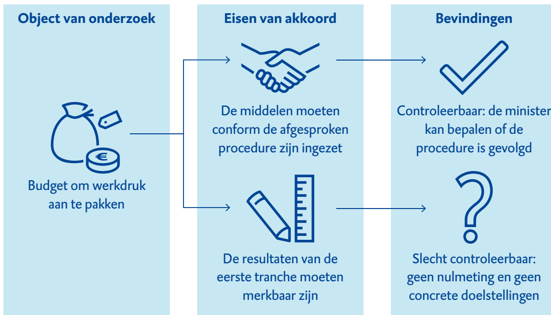
Figuur 2 Verantwoording