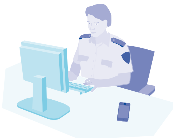
Figuur 5 ICT-ondersteuning politiewerk op straat