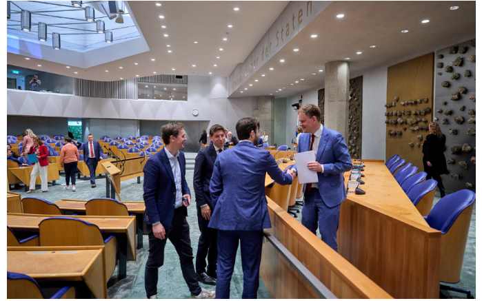
Na de toespraak in de Tweede Kamer

Verantwoordingsdag is een belangrijke dag geworden in het politieke jaar. En dit jaar