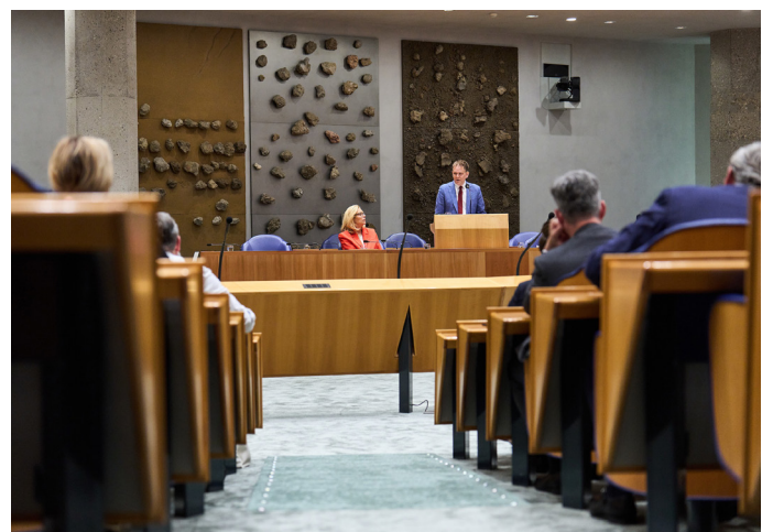
Toespraak van waarnemend president in de Tweede Kamer

Daarin leggen de ministers onder andere verantwoording af over hun uitgaven, ontvangsten en verplichtingen, de financiën dus. De minister van Financiën brengt op Verantwoordingsdag de jaarverslagen naar de Tweede Kamer. Daar spreekt ze Kamerleden