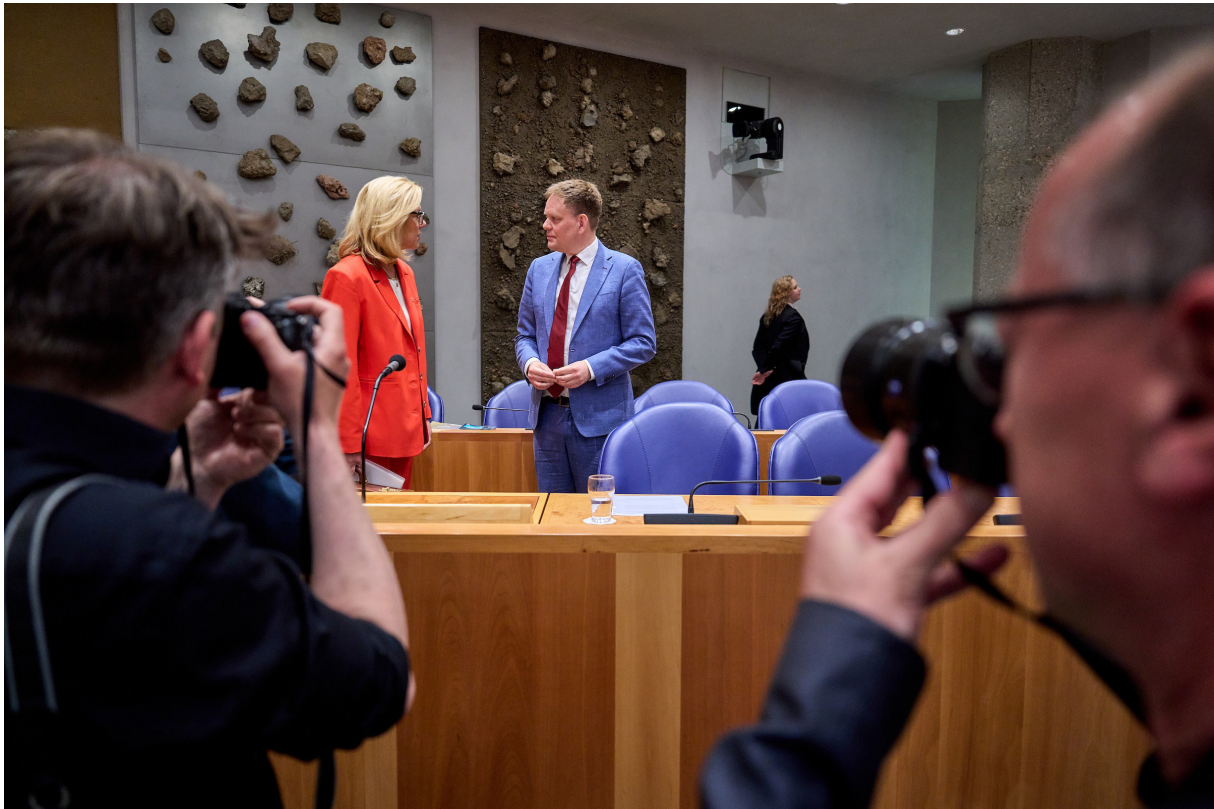
De minister van Financiën (links) praat na met waarnemend president van de Algemene Rekenkamer

Of ze daarbij de regels goed naleefden, is pas achteraf te controleren. Nu blijkt dat ministers dat niet altijd meer kunnen aantonen. Het gaat om veel geld, € 94,1 miljard aan afgerekende voorschotten in 2022. Van bijna 6% hiervan, € 5,6 miljard, is niet zeker of de regels zijn gevolgd. De Algemene Rekenkamer vindt dat ernstig. Zij erkent dat de maatregelen om de coronacrisis te bestrijden onder hoge druk tot stand kwamen. Maar het gaat over geld van burgers en bedrijven. Die mogen ervan uitgaan dat het juiste bedrag op de juiste plek terecht is gekomen.