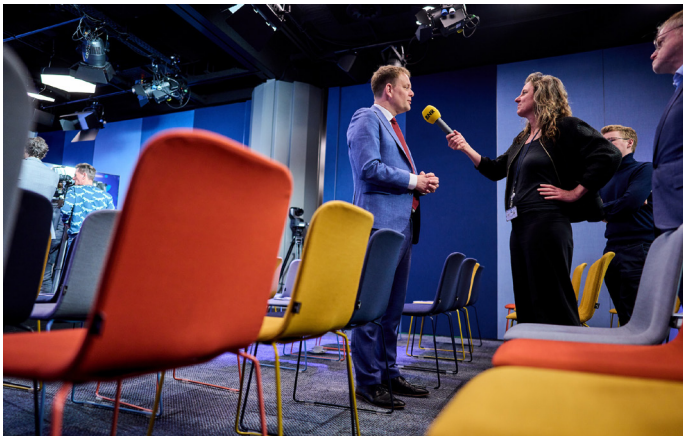
BNR interviewt waarnemend president