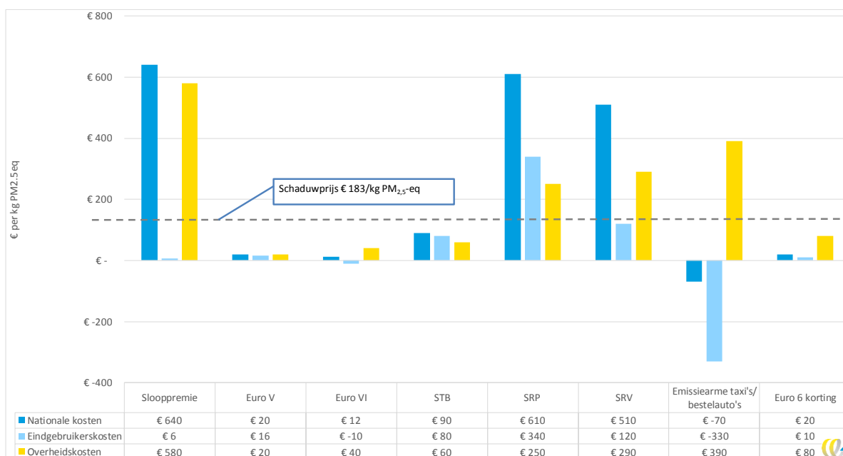
Figuur 1 - Kosteneffectiviteit van de acht luchtkwaliteitsmaatregelen, gecorrigeerd voor freeriders

De maatregelen Euro V, Euro VI, STB, Emissiearme taxi's en bestelauto's en Euro 6-korting hebben een nationale kosteneffectiviteit die negatief is, en lager dan de schadekosten van gemiddeld € 183 per kg PM 2,5eq 3 . Dit zijn maatregelen die vanuit maatschappelijk perspectief meer baten hebben opgeleverd dan kosten. Vanuit nationaal perspectief zijn de SRP-, de nationale slooppregeling en de SRV-regeling het minst kosteneffectief. Op het eerste gezicht lijken deze maatregelen duur, maar omdat sommige van deze maatregelen vooral aangrijpen op verkeer in steden (slooppremie, SRP en in mindere mate SRV) en deze maatregelen kunnen bijdragen aan het oplossen van lokale knelpunten in steden als gevolg van Europese luchtkwaliteitswetgeving, dient de kosteneffectiviteit van deze maatregelen in dat perspectief te worden gezien, en met alternatieven te worden vergeleken.