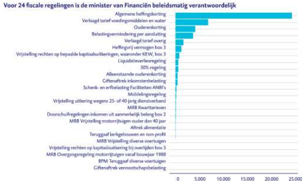
Figuur 2 Overzicht fiscale regelingen (bedragen * € miljoen)

In de onderstaande figuur geven we een overzicht van fiscale regelingen waarvoor 9/11 de minister van Financiën beleidsmatig verantwoordelijk is en waarvan het budgettair belang in bijlage 9 van de Miljoenennota is opgenomen.