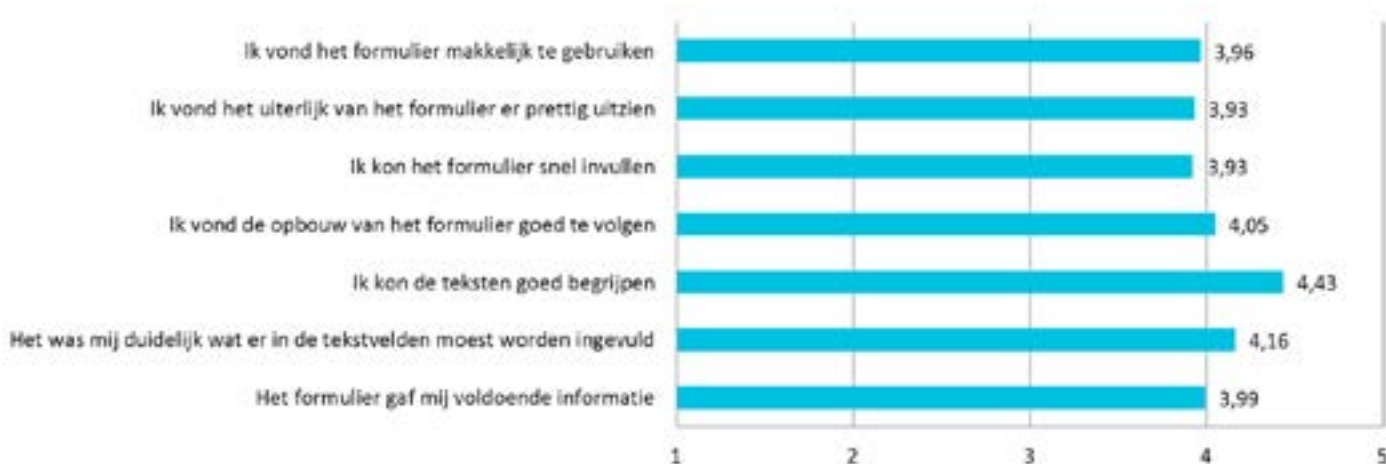
Figuur 1 Gemiddelde score respondenten straatinterviews en burgerpanel op een schaal van 1 tot 5

De uitkomsten van de straatinterviews en het burgerpanel laten zien dat op alle stellingen rondom de ervaren gebruiksvriendelijkheid gemiddeld hoog wordt gescoord: 4 op een schaal van 1 tot 5. De mate waarin de teksten in de webformulieren zijn te begrijpen ligt met 4,4 gemiddeld zelfs nog hoger.