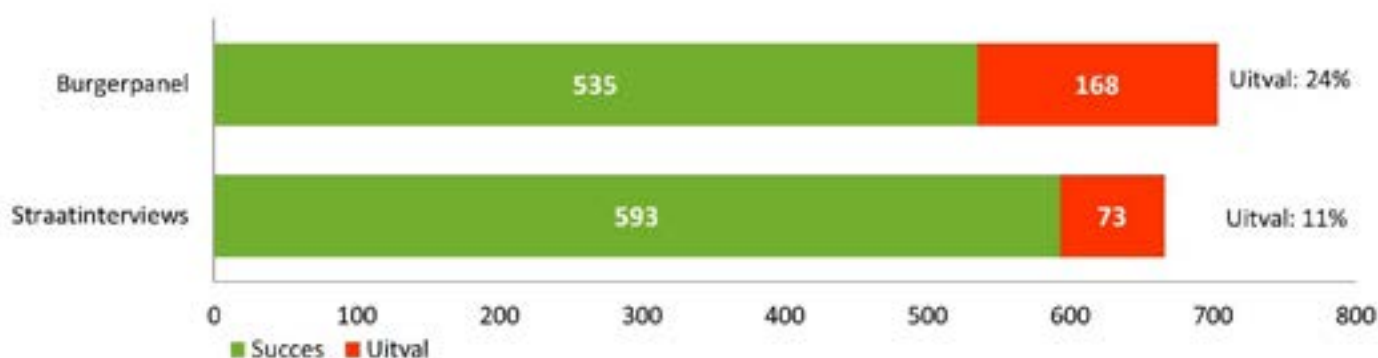
Figuur 4 Succes en uitval bij burgerpanel en straatinterviews

Er zijn verschillende redenen voor het niet volledig invullen van de vragenlijsten, bijvoorbeeld technische problemen of het niet kunnen openen van het formulier. Daarbij valt op dat 9% van de respondenten bij de straatinterviews uitvalt omdat ze de Nederlandse taal onvoldoende beheersen. Bij het burgerpanel is te zien dat 19% van de respondenten tussentijds is gestopt met het invullen van de vragenlijst.